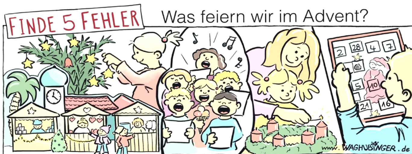
Palme, Tulpe, Eis, 5te Kerze, Türchen Nr. 28

Und vieles andere mehr. Ich fände es schön – und ich versuche es auch jedes Jahr –, wenn es auch ruhige Momente im Advent gibt. Damit ich mich auch innerlich ein bisschen auf Weihnachten vorbereiten kann, darauf, dass Jesus geboren ist. Darüber nachzudenken, was für ein großes Geschenk wir Menschen bekommen haben, dass Gott Mensch geworden ist. Dass er uns so sehr liebt. Das freut mich, und dann überlege ich mir, wie ich anderen eine Freude machen kann. Jetzt im Advent. Den Mitschülern, den Eltern oder Großeltern. Weihnachten ist ein Fest der Freude, und die Freude wird größer, wenn ich mit meinen kleinen Möglichkeiten Freude teile. Nicht erst am 25. Dezember, sondern jetzt schon im Advent. Versucht das doch auch einmal. Es macht Freude, Freude zu schenken. Und die Wartezeit auf Weihnachten wird auch kürzer.